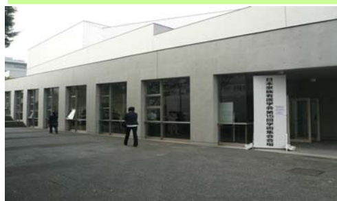
1161学術集会の会場である慶應義塾大学 湘南藤沢キャンパスθ館の風景